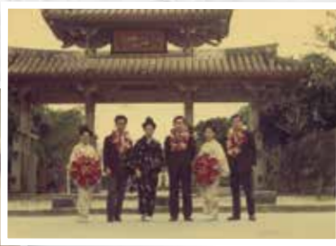
昭和48年 5年勤続社員報奨旅行は、前年に返還された沖縄へ