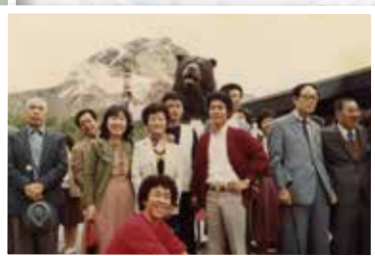
昭和58年9月 社内旅行は北海道の札幌・洞爺湖