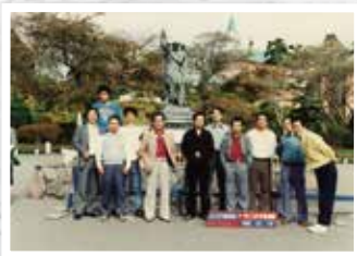
昭和62年 社内旅行は北海道