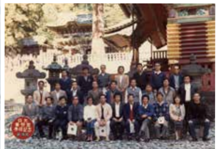
昭和59年 社内旅行は日光へ