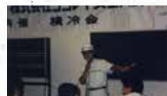
平成3年協力会社参加の「横冷会」で安全大会