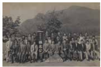
昭和47年 社員旅行 群馬榛名にて