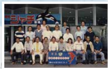
昭和61年10月 社内旅行は伊豆