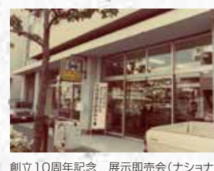
創立10周年記念 展示即売会(ナショナルショールームにて) 当時の目玉商品は、発売後間もなかった電子レンジ