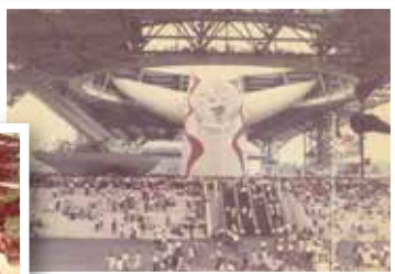
昭和45年 社員旅行は、高度成長期の象徴『大阪万博(EXPO'70)』