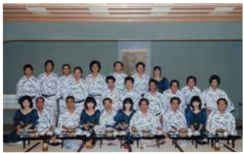
昭和61年6月 横冷会結成10周年を記念して 横冷会のみなさんと熱海