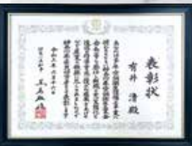
神奈川県民功労者表彰