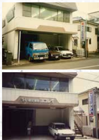
昭和62年1月 新社屋竣工 実はこの頃、社名を横浜冷暖房設備株式会社→株式会社ヨコレイに変更を考えていて看板を掲げない状態にした