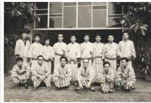
昭和44年9月 初めての社員旅行は、『熱海・翠光園ホテル』

創業三年目の昭和四四年(一九六九年)に、ヨコレいの社員旅行はスタートしました。映画『ALWAYS 三丁目の夕日』の次回作になりそうな、懐かしいセピアの写真。社員を家族のように大切に作る時代でした。創業期を疾走した昭和のヨコレいを、ここでは社員のオフの姿を通してご紹介します。