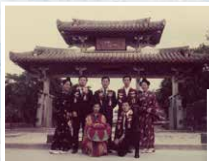
昭和58年 5年勤続社員報奨旅行は沖縄へ