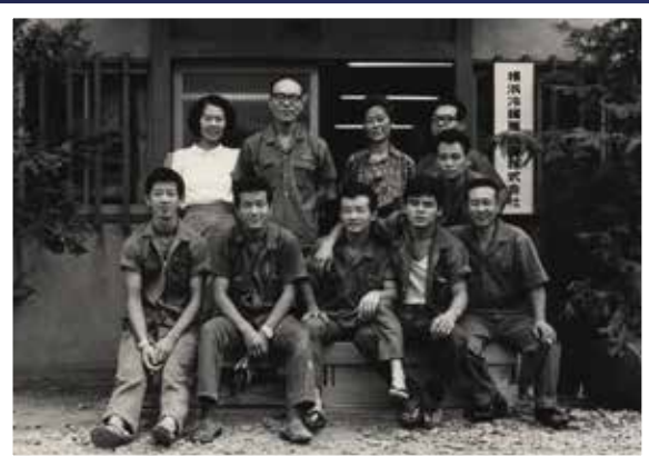
1967年、手狭になり創業2年目に移転した事務所兼工場の前で…。 松下倉庫敷地内にある木造2階建ての1階で修理と整備に明け暮れた。