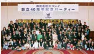
創立40周年記念パーティー

Yokoray Total Expenses Management Systemの略語で、ヨコレイ総原価管理システムのこと。社員の日報を基に工事・メンテナンス・サービスの1案件ごとに、ほぼリアルタイムで原価管理を行っています。サービスの原価を把握し「見える化」することで適正価格によるサービスの提供を実現しています。