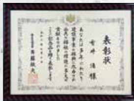
国土交通大臣表彰