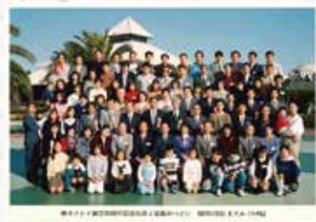
創立30周年記念社員と家族のつどい

『経営理念・ミッション経営』を社内でも共有し、実践していくための社内の取り組みの一つ。組織横断型の委員会活動を行っています。2002年のQMS改善委員会(ISO9001認証継続)発足を皮切りに、現在7つの委員会が活動しています。