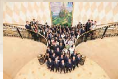
創立50周年記念パーティー