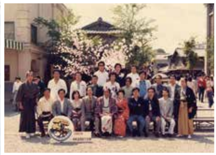
昭和56年 京都方面へ社員旅行 一部協力会社の方も参加されました