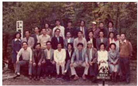
昭和51年10月 社内旅行で富士五湖へ