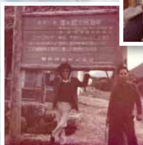
昭和50年 5年勤続社員報奨旅行 鹿児島県徳之島