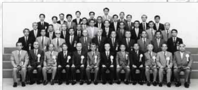
横浜市優良工事請負業者表彰を受賞