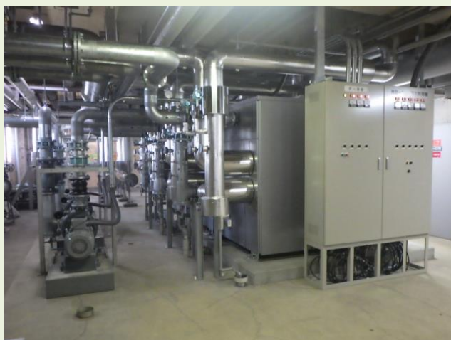
(神奈川県ライトセンター機械室内の写真)

3月に竣工した神奈川県ライトセンター空調設備改修工事の現場をご紹介します！当センターは横浜市旭区に所在する視覚障害を持つ人を対象とした複合福祉施設です。この工事は神奈川県発注の公共工事で、空調設備の老朽化に伴い、冷温水発生機や冷温水ポンプの更新、また自動制御設備と一部冷温水配管の改修工事を行いました。機能はもちろんですが、メンテナンススペースや配管の識別、仕上げにもこだわって心をこめて施工いたしました。また、本工事は、当社の手がけた公共工事として初めて完全土日休みの週休2日と9時～17時までの完全残業なしを達成した現場となりました。