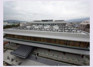
開成町新庁舎

※ ZEB（100%以上の省エネ） Nearly ZEB（75%以上の省エネ） ZEB Ready（50%以上の省エネ）